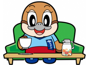
不要不急の外出自粛